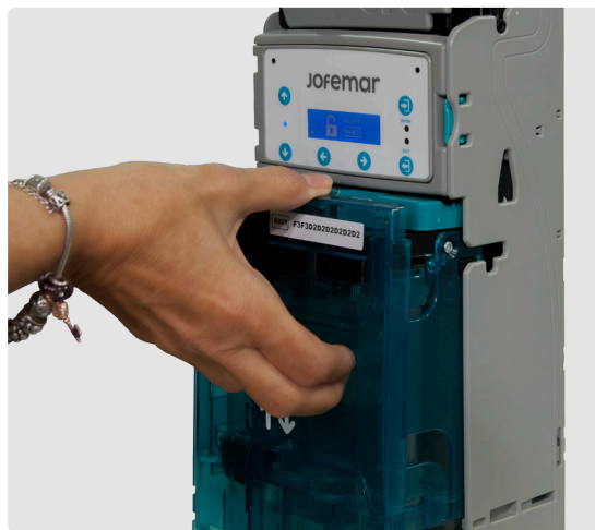
Cassete de 8 tubos de devolución extraíble, con opción de código de seguridad.