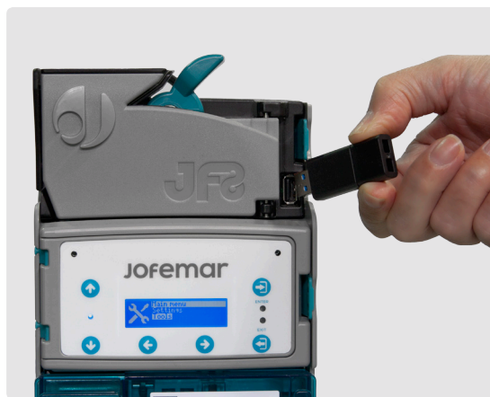
Actualizaciones y descarga de datos a través de puerto USB.